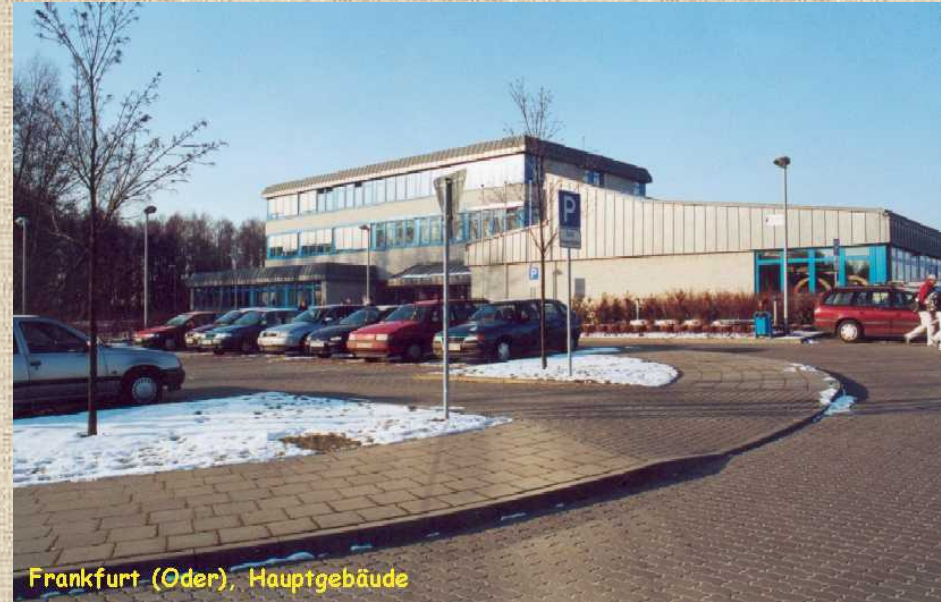
Frankfurt (Oder), Hauptgebäude

ÜAZ Bauwirtschaft Frankfurt (Oder)-Wriezen Am Erlengrund 20 15234 Frankfurt (Oder)